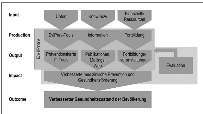
Abbildung 2 Outcome EviPrev.

EviPrev will den schweizerischen Ärztinnen und Ärzten in Übereinstimmung mit internationalen Empfehlungen einen umfassenden Ansatz im Bereich der Prävention und neue Instrumente für ihre präventiven Interventionen in der Praxis liefern. Das Programm ergänzt das Projekt «Gesundheitscoaching» des Kollegiums für Hausarztmedizin [21]. Die praktische Umsetzung (Anpassung an die Realitäten in der Arztpraxis) sowie die Evaluation der Wirksamkeit werden durch eine Gruppe wahrgenommen, die sich aus Vertreterinnen und Vertretern der PMU Lausanne und der fünf Institute für Hausarztmedizin zusammensetzt.